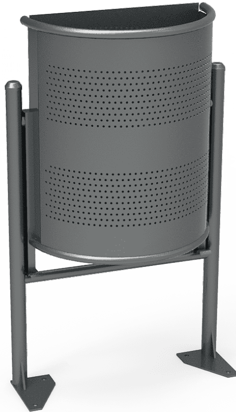
Semi-Circular Inox PA616I