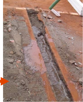
Colocación del mortero