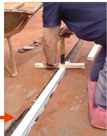
Nivelación de la nueva línea