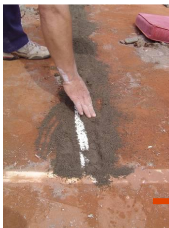
Rellenado con pastilla.