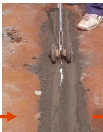
Limpieza de la línea