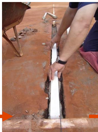
Colocación de la línea nueva