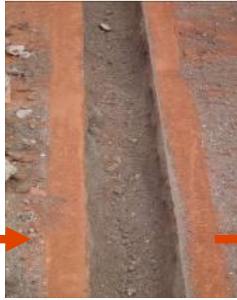
Saneamiento de la zanja