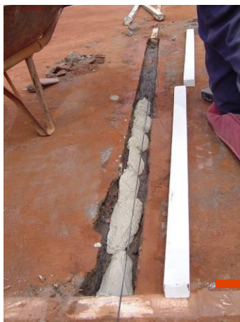
Nivelación y allanamiento