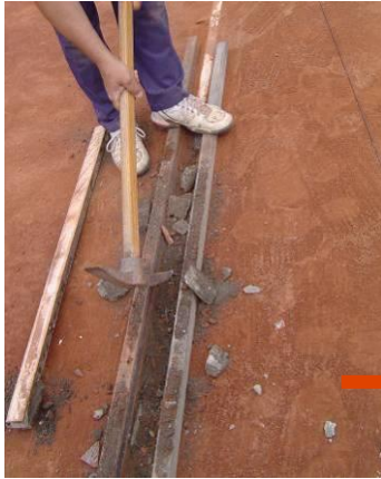
Extracción de la línea antigua

En las fotografías se muestra el montaje de una línea prefabricada.